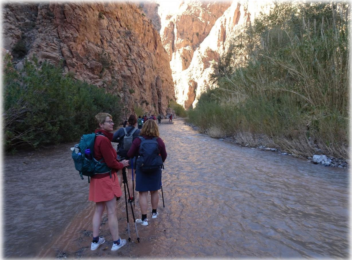
Wij trekken terug door het water.