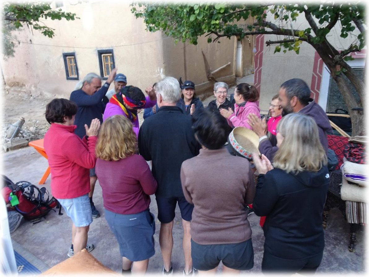
We beginnen de ochtend al meteen met muziek en dans.