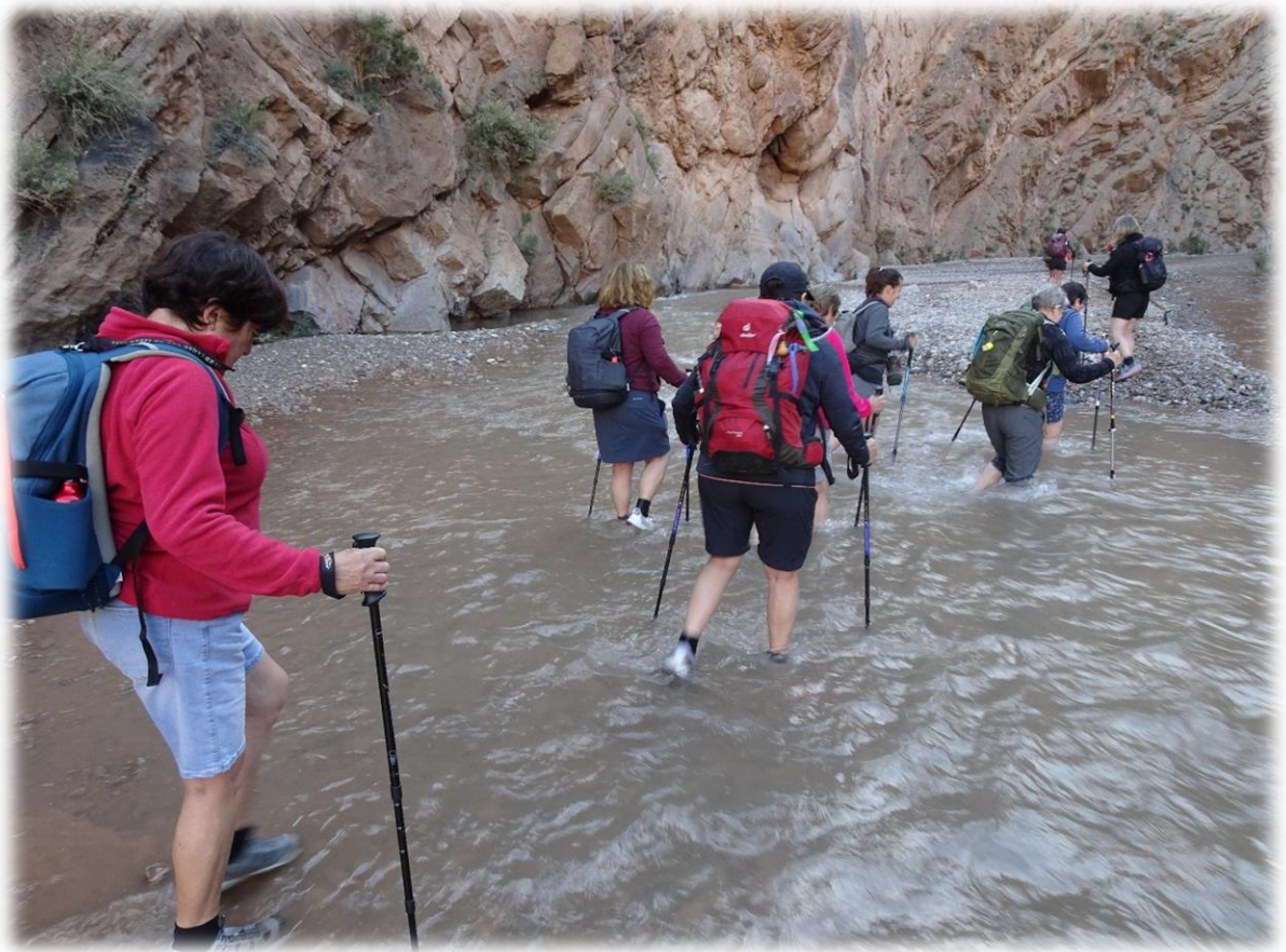
Vandaag dienen we af en toe door het water te stappen.