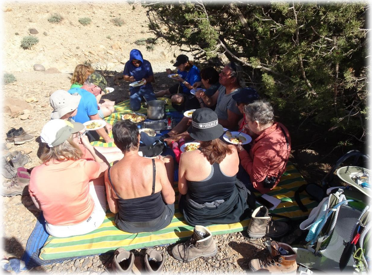
Onze kok heeft terug voor een heerlijke maaltijd gezorgd.