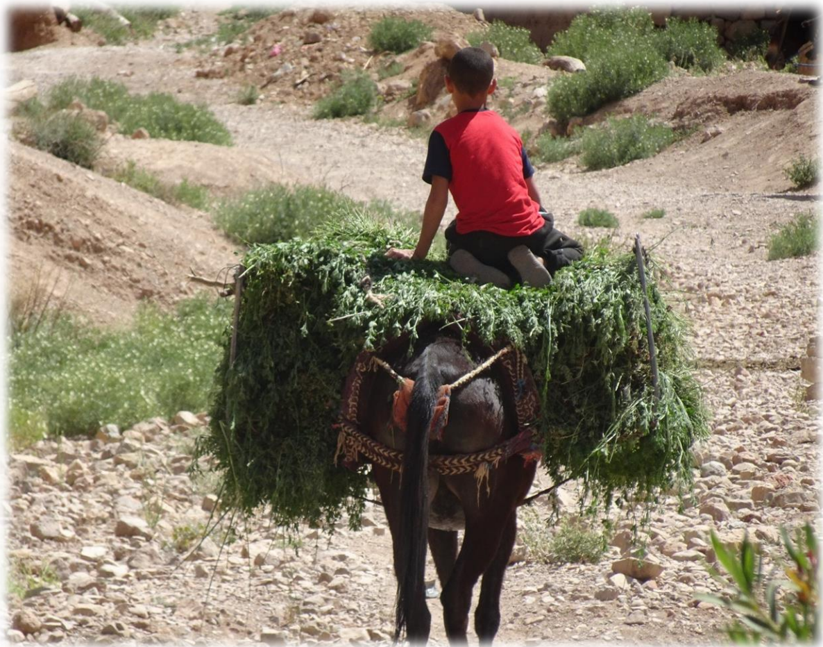
Na schooltijd dienen de kinderen te helpen op het land.