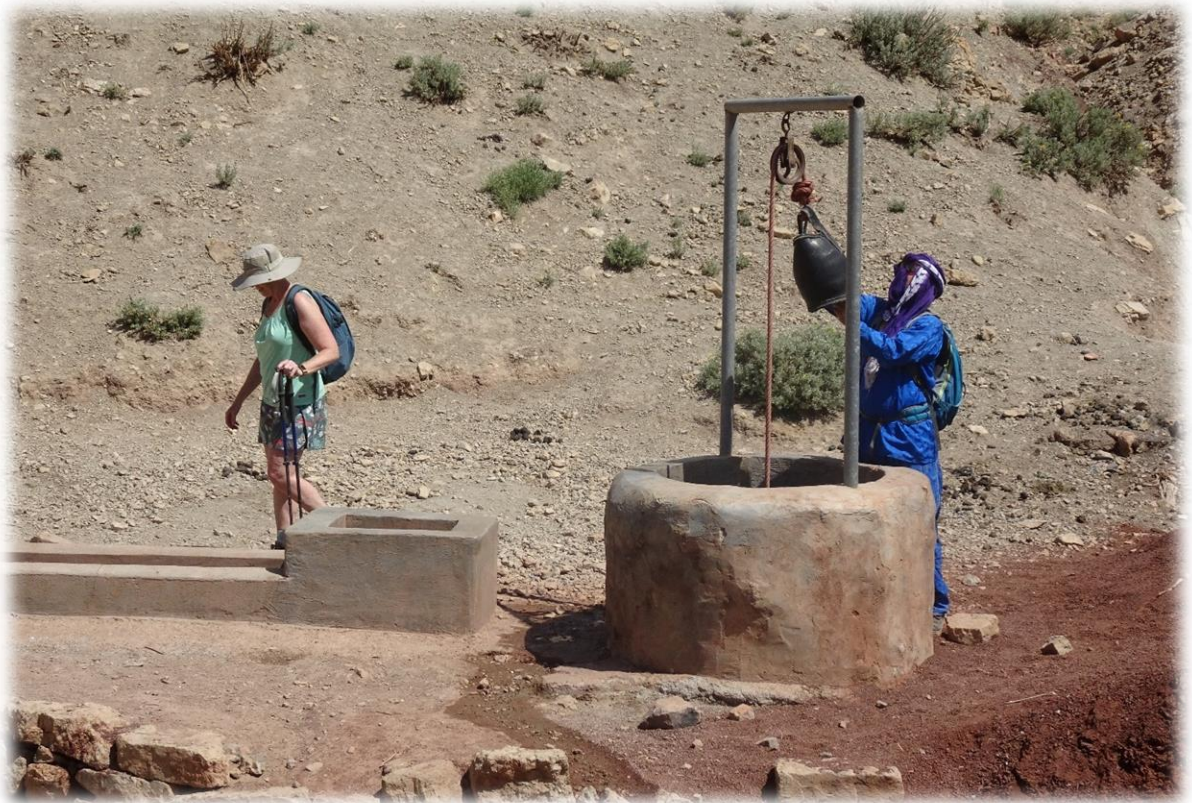
We komen onderweg een waterput tegen. De emmer dient ongeveer twintig meter naar beneden te gaan om drinkbaar water te bekomen.