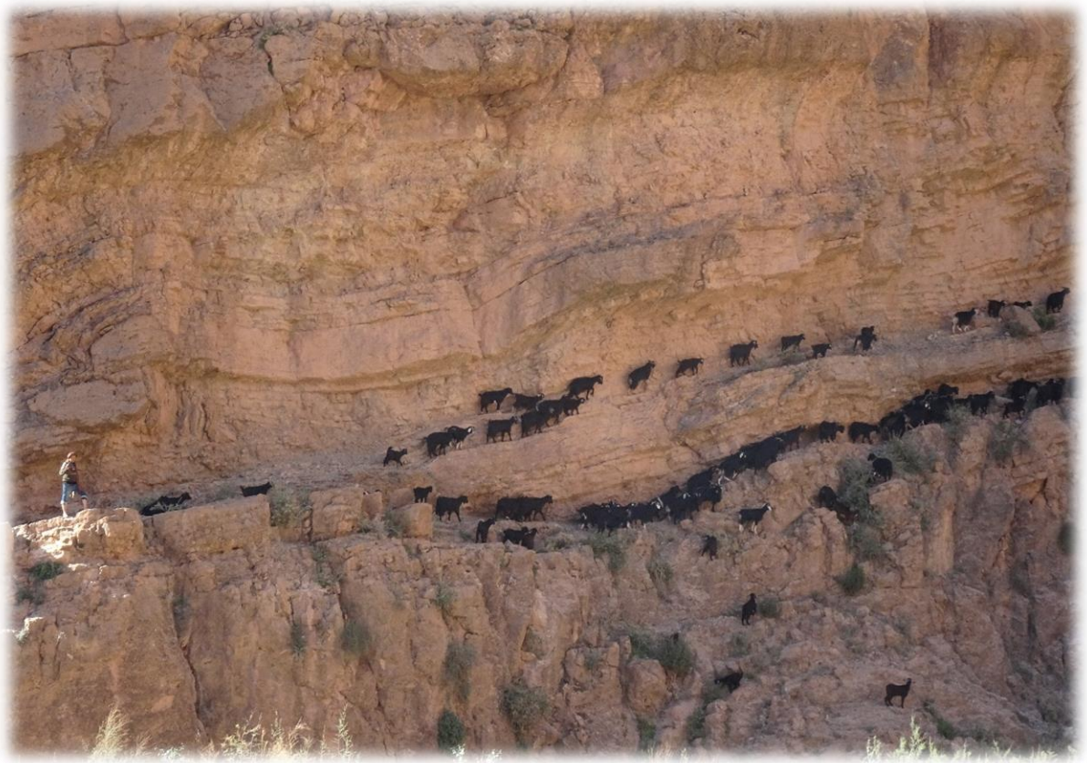
Een kudde geiten trekt de bergen in op zoek naar wat lekkers.