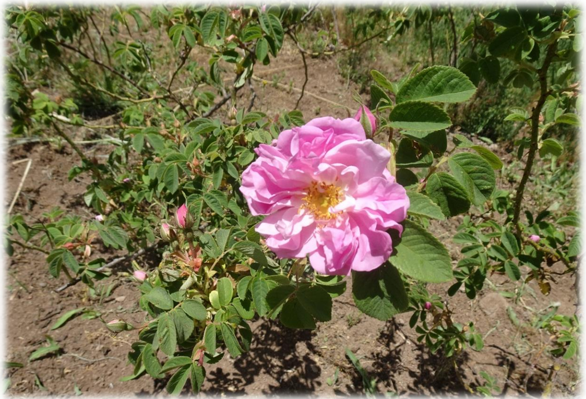
Een zeldzaam bloeiende roos. Deze tijd van het jaar is er immers geen bloem meer.